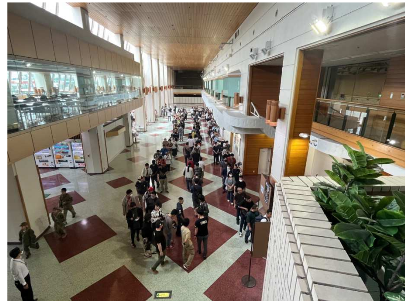
第一回目 開催の様子